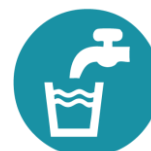
Alimentation en eau potable (AEP)