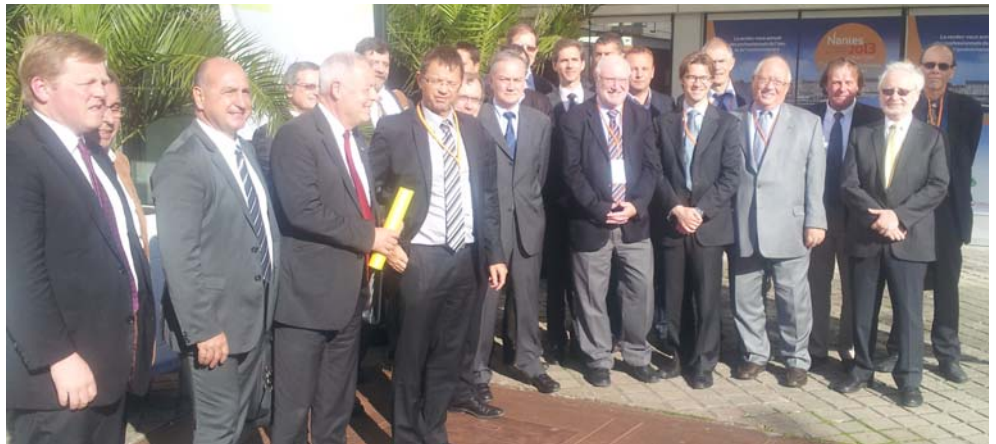
Signature de la charte de qualité des réseaux d'eau potable nationale le 3 juin 2013

Dès 2011, les animateurs de la Charte Languedoc-Roussillon participaient à l'élaboration de la Charte nationale de qualité des réseaux d'eau potable, signée le 3 Juin 2013 lors du congrès de l'ASTEE.